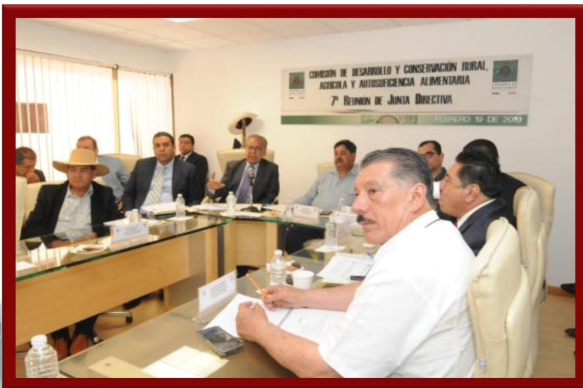
Séptima Reunión de Junta Directiva 19-02-2019