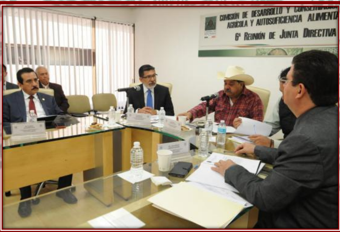
Sexta Reunión de Junta Directiva 07-02-2019