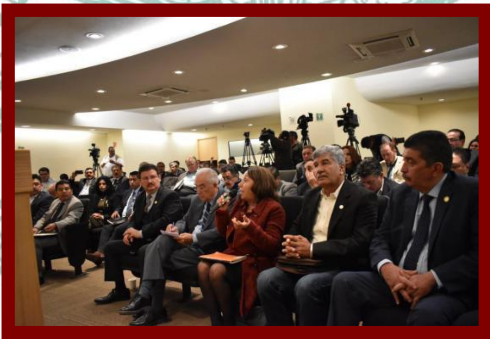
Reunión de Trabajo con el Titular de la SADER 13 de diciembre de 2018