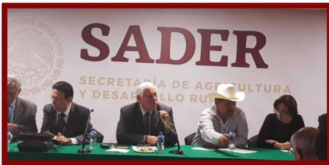
Reunión de Trabajo con el Titular de la SADER 6 de marzo 2019