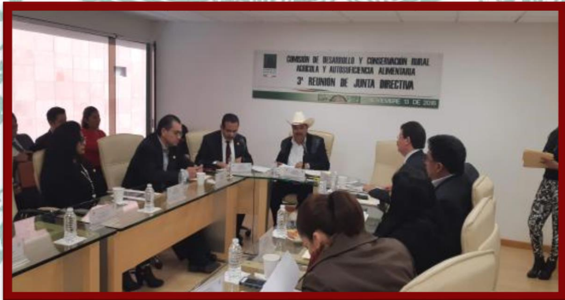
Tercera Reunión de Junta Ordinaria 13-11-2018