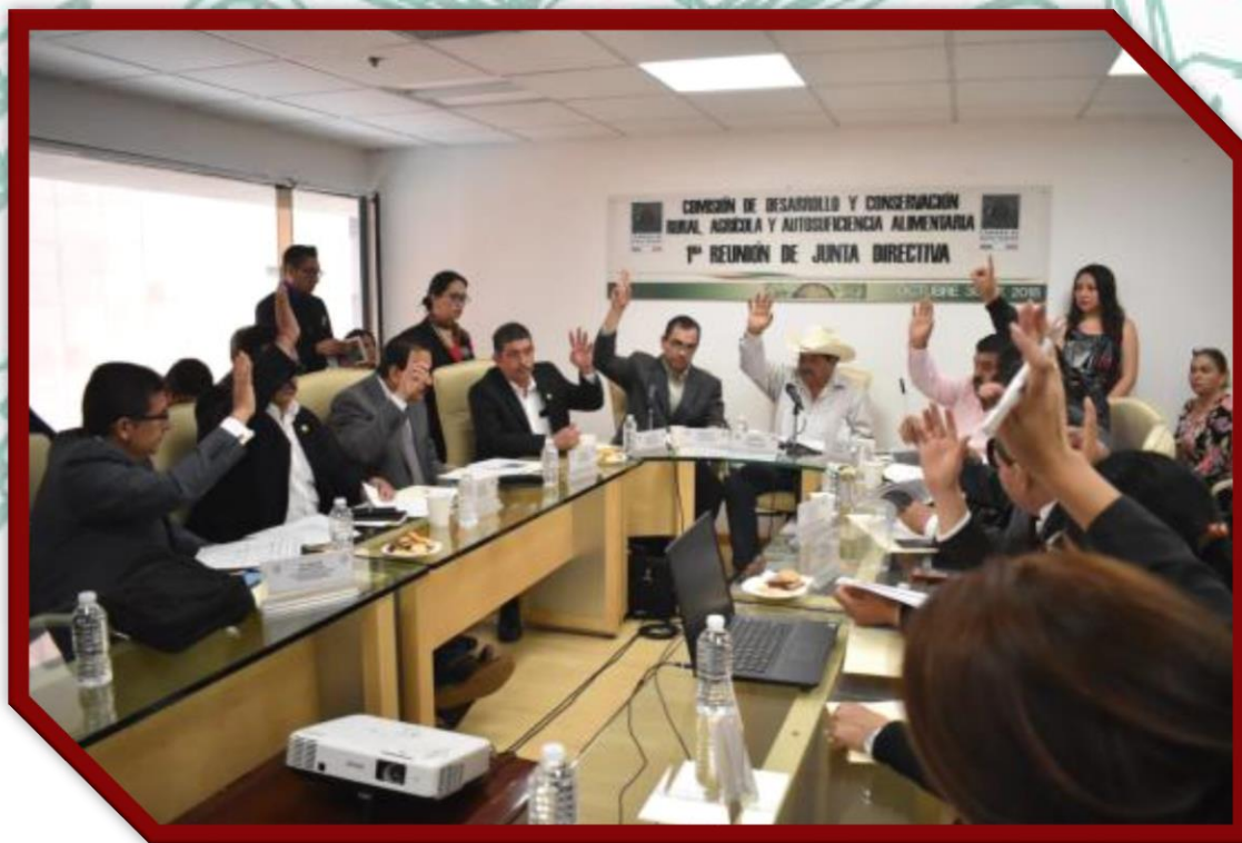
Primera Reunión de Junta Directiva 30-10-2018