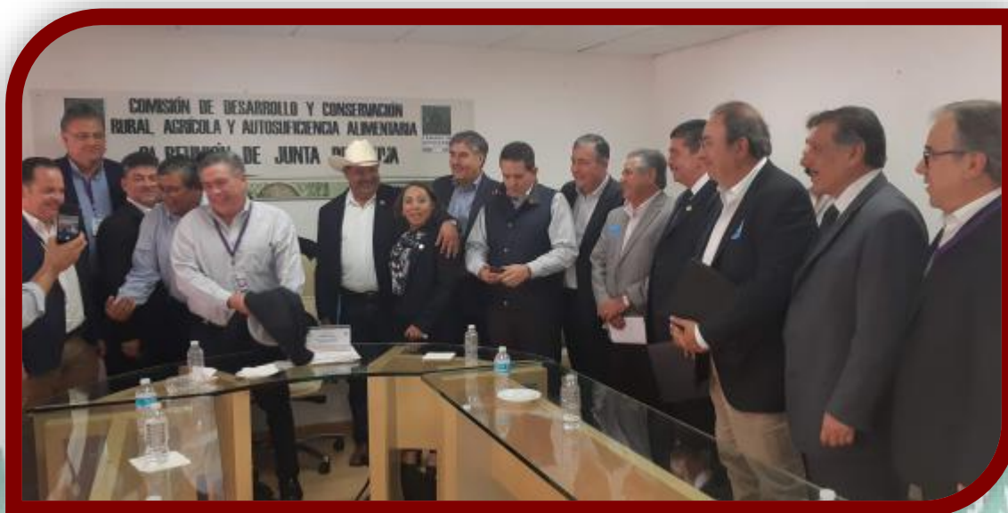
Segunda Reunión de Junta Directiva 06-11-2018