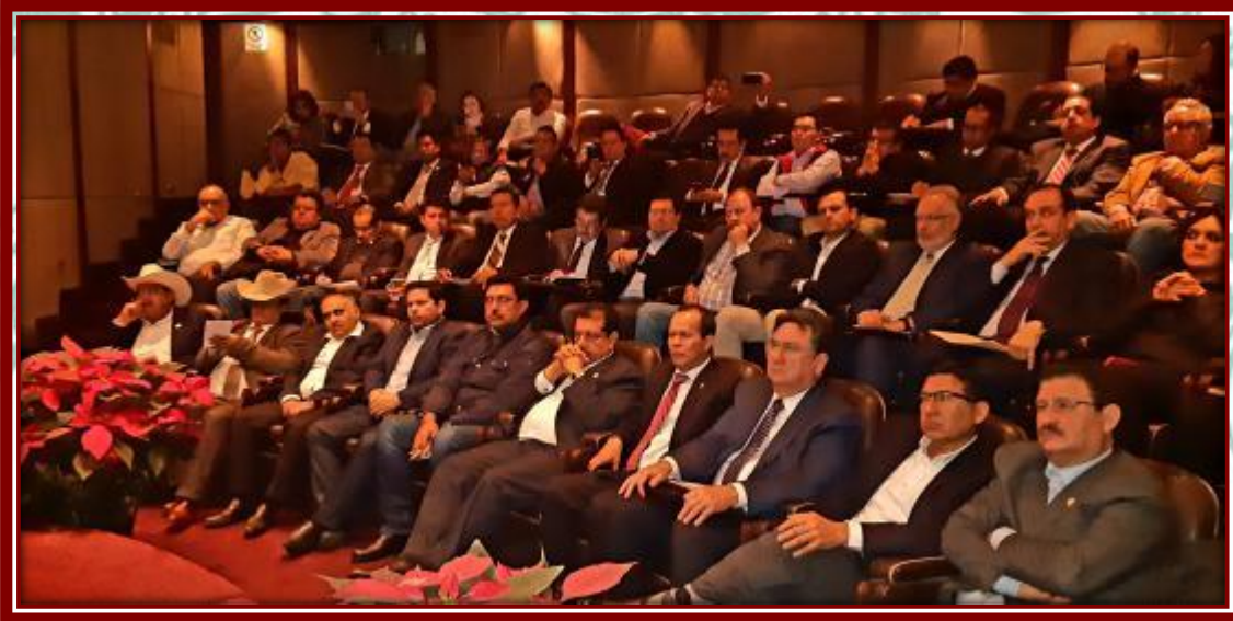
Reunión de Trabajo AMSDA 22 de noviembre de 2018